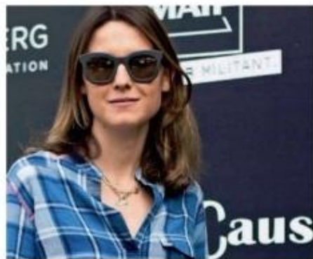
撰文 Haria Casati

奢华时尚酒店、逛街购物的新热点以及难得一遇的艺术展……以下即为本月伦敦的TO DO LIST。