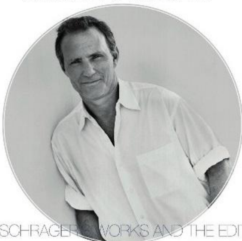
IAN SCHRAGER, WORKS AND THE EDITION

五月份開張的The New York EDITION——是Ian Schrager與Marriott合作的酒店品牌EDITION的第四個項目。距離在麥迪遜大道上Schrager在紐約創辦的第一家酒店Morgans，只十分鐘路程，就見證了精品酒店之父三十多年的Boutique Hotel之旅。